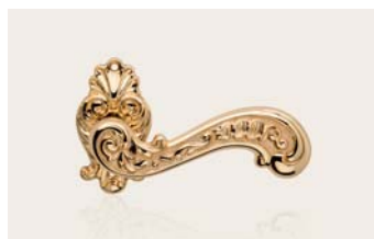
oro zecchino gold plated OZ