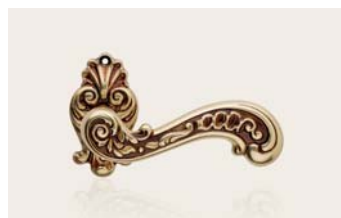
oro francese french gold OF