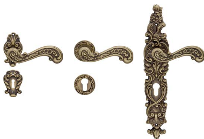
1520 RB 015