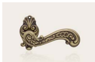
patiné patiné mat PM